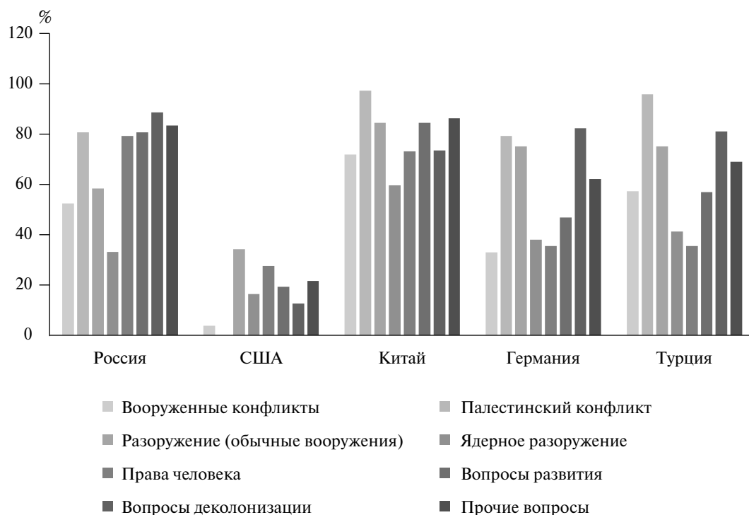
Рис. 2. Совпадение голосов Казахстана с Россией, США, Китаем, Турцией и Германией при голосовании по резолюциям ГА ООН с 2007 по 2022 г. по отдельным вопросам, %